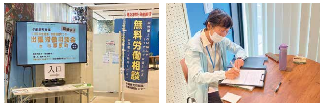
与那原町で開催された出張労働相談会の様子